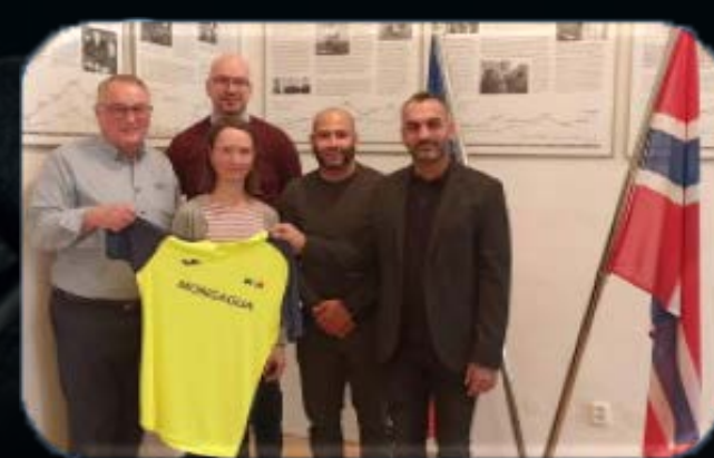
Návštěva norského velvyslanectví