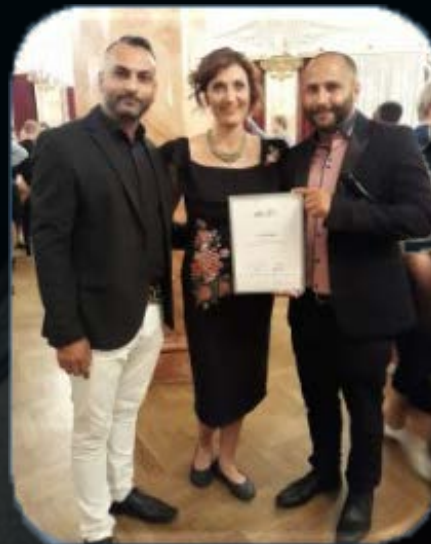
Předávání cen Gratias Tibi za nejlepší sociální projekt

Snažíme se opravovat a budovat tyto hřiště, je to ten nejlepší způsob aby děti našli cestu k vzájemnému přátelství a přirozené lásce ke sportu.