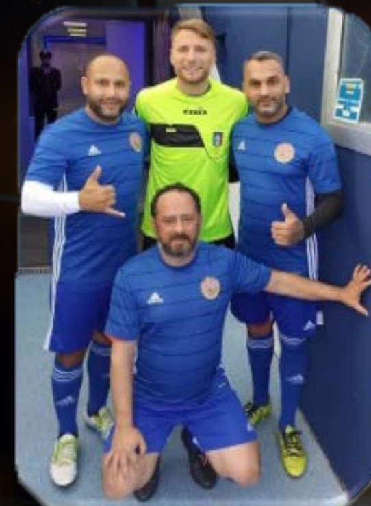
Setkání s Ciro Immobilem