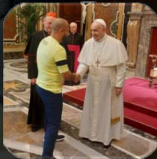
Audience u Papeže Františka